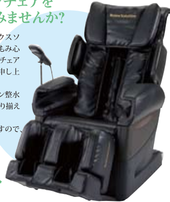
リラックスソリューション(SKS-4500)